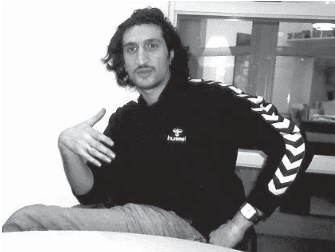
Skådespelaren Fares Fares ville bli läkare eller ingenjör när han var liten. I dag gör han både film och teater och en av hans förebilder är Al Pacino.